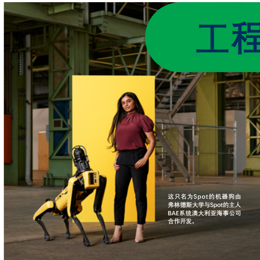
这只名为Spot的机器狗由弗林德斯大学与Spot的主人BAE系统澳大利亚海事公司合作开发。